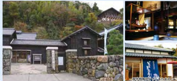
北前船主的馆 右近家 北前船资源中心 地图号 B-2

位于右近家北面的旧道被称为河野北前船主通大街，能让人感受到北前船的繁荣时代。(照片上：中村家住宅是国定重要文化财产，内部不公开)