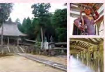
妙泰寺 地图页 B-3

日莲宗，大谷山妙泰寺已有700多年的历史，是北陆为数不多的有由来的寺院。从总门进去200米处，立着仁王像的仁王门和三十间的过渡走廊、本堂等处是值得一看的地方。