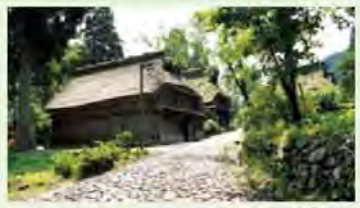
街道浪漫·今庄宿 9月

令人缅怀昔日宿场町的演艺活动。还会表演今庄羽根曾舞，这是县的非物质民族文化遗产。 会场：今庄宿