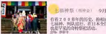
七福神祭（明神会） 9月

用莲茎代替吸管来品尝饮料的象鼻杯和用莲花纤维制作藕丝纸的体验等活动。莲花竞相开放，拍摄照片也是人气很旺的观光内容。 会场：莲花公园