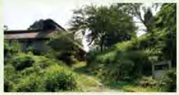
木之芽岭 北陆道的交通要道 地图 D-3

这是曾在江户时代还设置了关所的宿场町。茅草修葺的屋顶采用的是所谓“兜作”的形式。