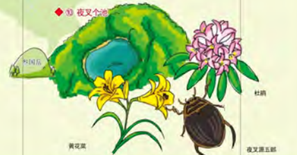
荷花、黄花草、夜叉藤、杜桐、夜叉藤五郎