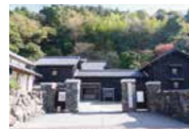
うこんげ 北前船主の館 右近家