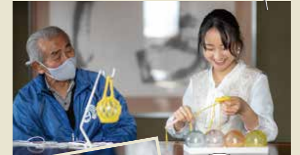
好きな色 の浮き球を 選んでね♪