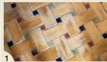
床や壁の タイルも かわいい♡

西洋館は昭和の大恐慌時に 働き先を失った河野の村人 を雇用するために建てられ ました。