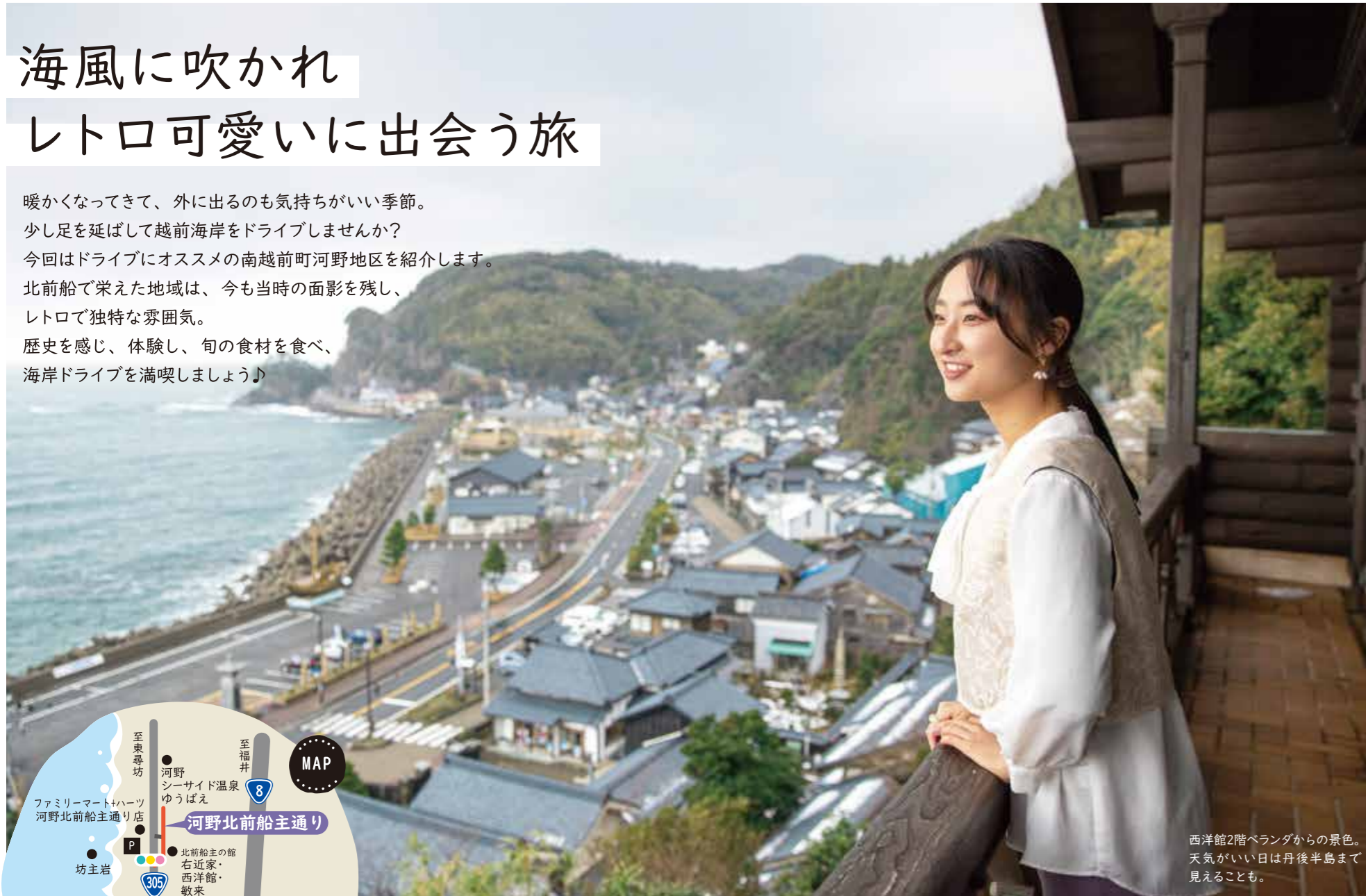
西洋館2階ベランダからの景色。 天気がいい日は丹後半島まで 見えることも。

暖かくなってきて、外に出るのも気持ちがいい季節。 少し足を延ばして越前海岸をドライブしませんか？ 今回はドライブにオススメの南越前町河野地区を紹介します。 北前船で栄えた地域は、今も当時の面影を残し、 レトロで独特な雰囲気。 歴史を感じ、体験し、旬の食材を食べ、 海岸ドライブを満喫しましょう♪